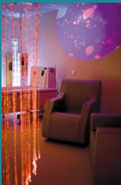
Salle Snoezelen , de stimulations sensorielles, dans une démarche d'amélioration de l'accompagnement des personnes atteintes de la maladie d'Alzheimer.